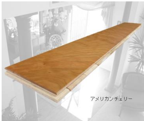
アメリカンチェリー