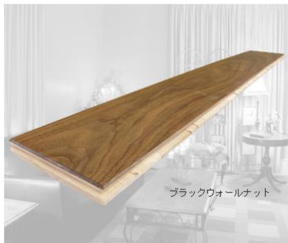
ブラックウォールナット

ブラックウォールナット 品番 : NR3N-BW5203R ¥27,825- / ケース