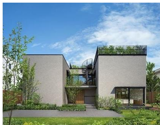
『artim(アーティム)』 駒沢公園ハウジングギャラリー